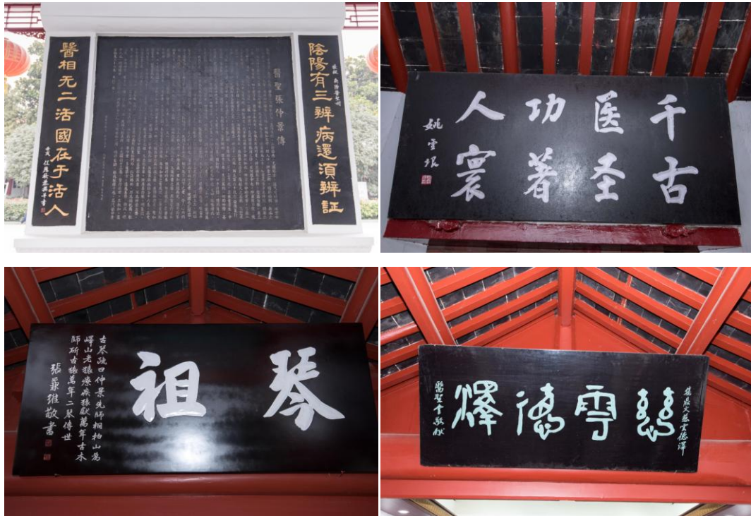
医圣祠中张仲景传碑文与建筑上的名人题字牌匾

“麻醉走基层 精准帮扶路”活动将按照中国中西医结合学会麻醉专业委员会走基层帮扶活动路线图持续开展，通过点对点、面对面的帮扶活动，以提高基层医院，特别是基层中医医院麻醉医师的专业素质和学科理念。保障基层医疗单位的临床麻醉安全和管理水平，同时，也进一步促进中西医结合临床麻醉在基层医院的应用和开展。