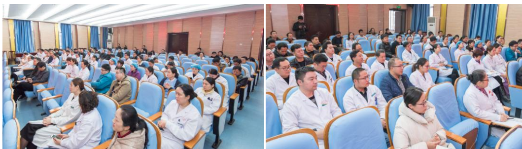
CSIA 走基层帮扶活动第二站南阳市中医院活动现场